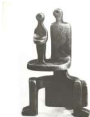
Отец с сыном

Вы смотрите на бронзовую скульптуру «Отец с сыном», форма которой в чем-то даже сходна по языку с работами Мура. Отец сидит и так твердо опирается ногами о землю, не сдвинешь, и так основательно поддерживает сына превратившимися в широкую плиту руками, что нет сомнений – всё надёжно, этой плиты-опоры можно идти в жизнь.