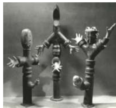
Пророки XX века

Их головы наполнены истинами бытия. Огнедышащий утюг с разверстой зубастой пастью, готовой перемалывать и поглощать, бензиновый бачок с дырками-глазами, испускающий смрад духа, и искореженный цилиндр мотоциклетного двигателя, издающий попмузыкальное сопровождение действию. Они готовы своим канализационным содержимым оплодотворять будущее. Смотришь и узнаешь XX век, и невольно думаешь – не их ли ждал век XXI-й?