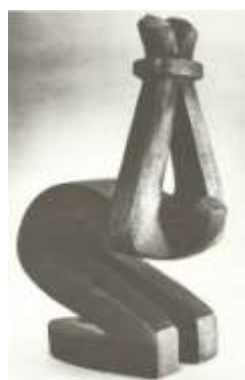
Памятник жертвам насилия

Самым страшным, оцепеневающим было смотреть на «Железных пророков». Они в моей памяти, по-моему, это я слышал от самого Сидура, остались как «Пророки XX века». Удивительно, что он сумел сотворить сочетанием канализационных труб с другим «мусором» в его Подвале! Перед вами три черных чугунных монстра с жадно растопыренными пальцами на раскинутых руках, несущие опыт века.